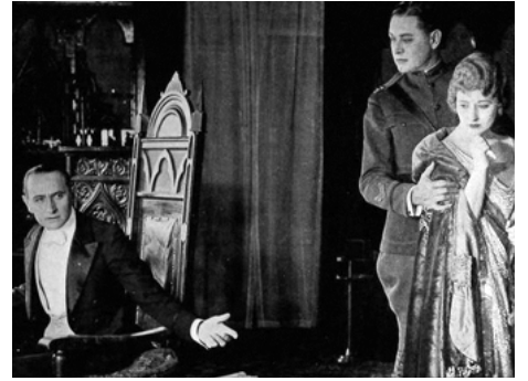
1920 LE PASSE-PARTOUT DU DIABLE (The Devil's Passkey) d'Erich von Stroheim avec Sam De Grasse, Leo White