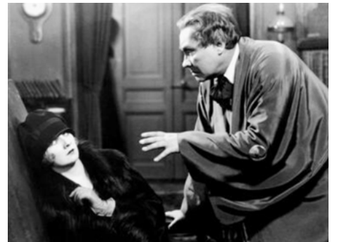
1926 LE MAGICIEN (The Magician) de Rex Ingram avec Paul Wegener