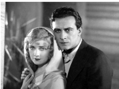
1927 LE JARDIN D'ALLAH (The Garden of Allah) de Rex Ingram avec Ivan Petrovich