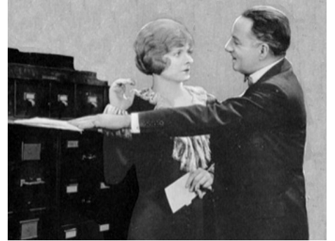
1925 ANY WOMAN d'Henry King avec Henry Kolker