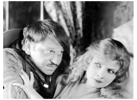
1924 LA RANÇON (The Great Deceit) de Reginald Barker avec Wallace Beery