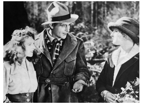
1919 LA VALLÉE DES GÉANTS (The Valley of the Giants) de James Cruze avec Wallace Reid, Grace Diamond