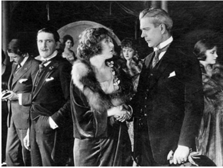
1919 THE DAY SHE PAID de Rex Ingram avec Francelia Billington, Charles Clary