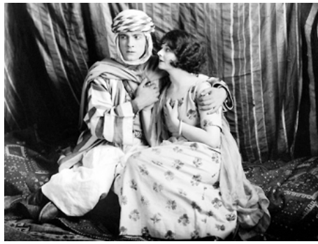
1924 L'ARABE (The Arab) de Rex Ingram avec Ramon Novarro