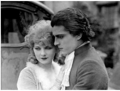
1923 SCARAMOUCHE (Scaramouche) de Rex Ingram avec Ramon Novarro