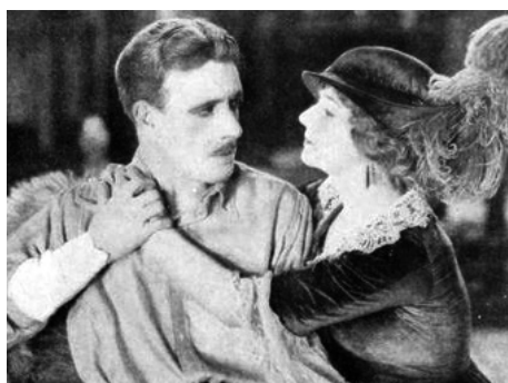
1922 LE PRISONNIER DE ZENDA (The Prisoner of Zenda) de Rex Ingram avec Lewis Stone