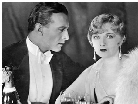
1928 LES TROIS PASSIONS (The three Passions) de Rex Ingram avec Ivan Petrovich