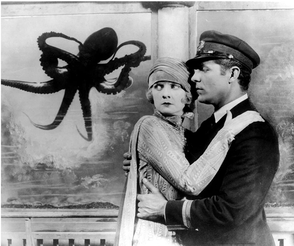
1926 MARE NOSTRUM (Our Sea) de Rex Ingram avec Antonio Moreno