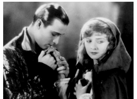
1921 EUGÉNIE GRANDET (The Conquering Power) de Rex Ingram avec Rudolph Valentino