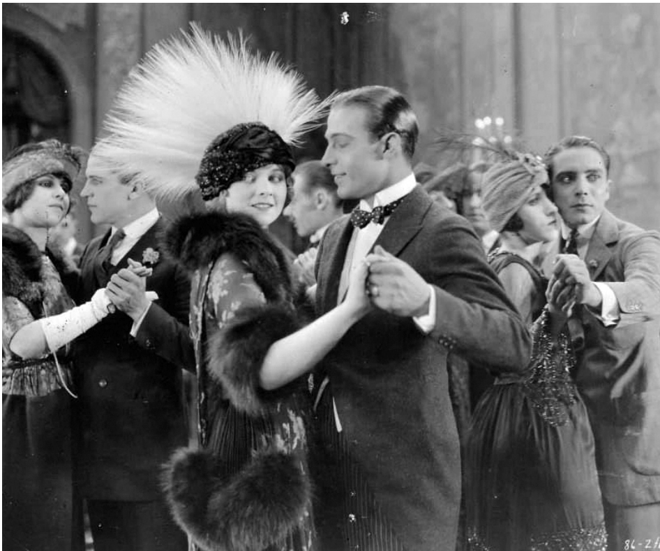
1921 LES 4 CAVALIERS DE L'APOCALYPSE (The 4 Horsemen of the Apocalypse) de Rex Ingram avec Rudolph Valentino