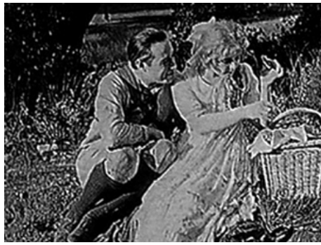
1918 L'ÉCHANGE (Old Wives for New) de Cecil B. De Mille avec Elliott Dexter