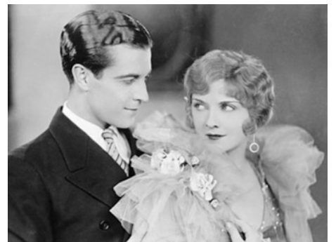
1927 LES AMANTS (Lovers ?) de John M. Stahl avec Ramon Novarro