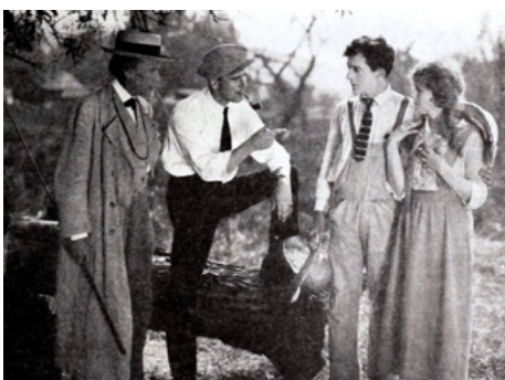
1921 LE CHEMIN DE L'HONNEUR (Turn to the Right) de Rex Ingram avec Jack Mulhall