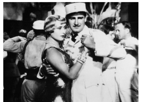
1932 BAROUD (Love in Morocco) de Rex Ingram & Alice Terry avec Jean Galland